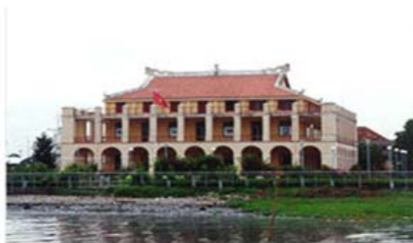
Bến cảng Nhà Rồng