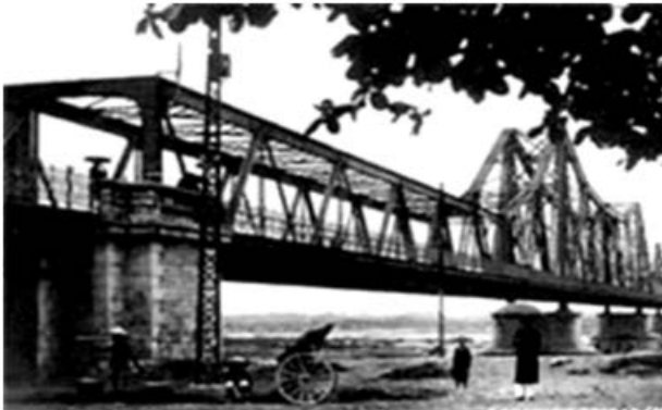
Cầu Long Biên