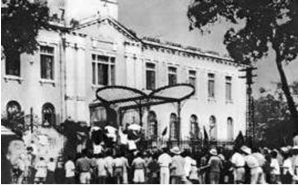
Phủ toàn quyền Đông Dương tại Hà Nội