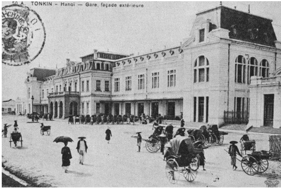
Ga Hà Nội (1900)